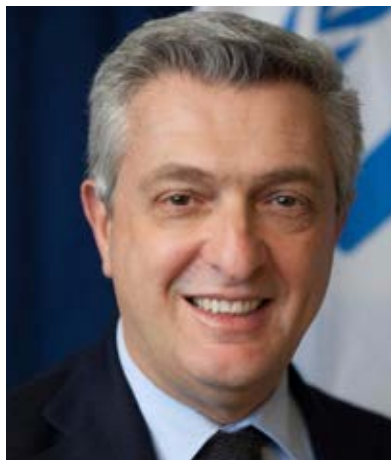
Filippo Grandi Kamishina Mkuu wa Wakimbizi wa Umoja wa Mataifa