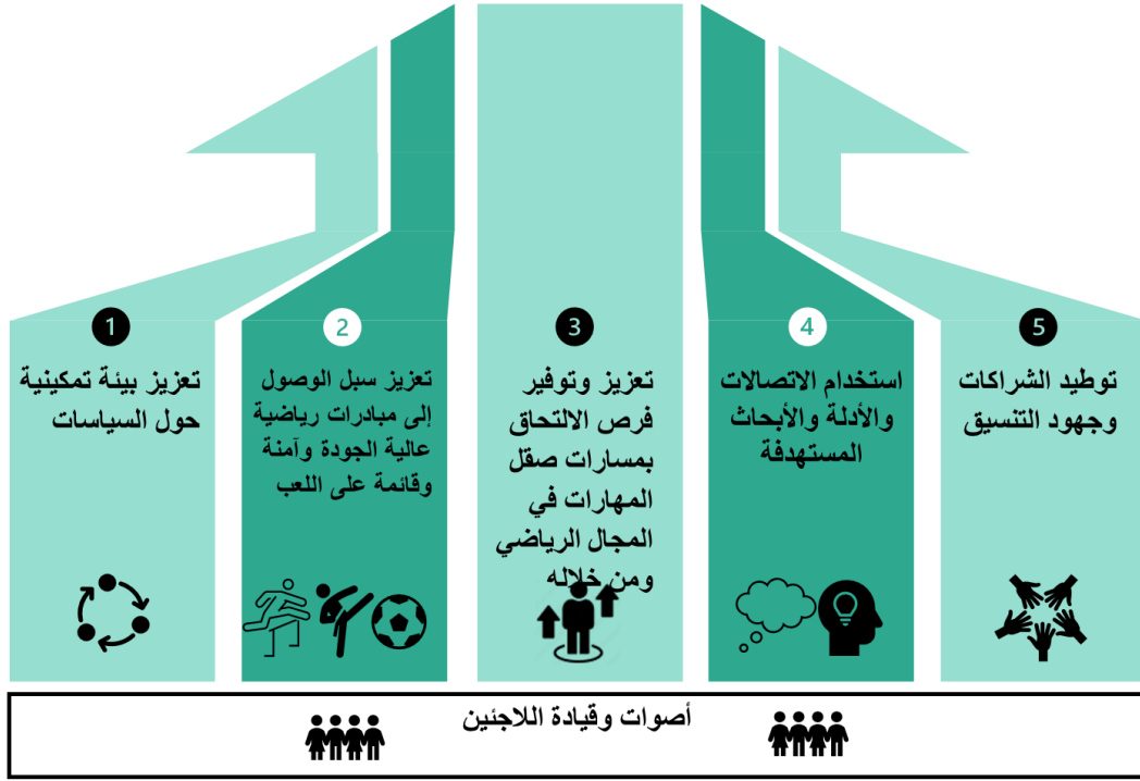
الشكل 2: تفاصيل التعهد ومجالات الالتزام التي تشكل التعهد الرياضي المشترك لعام 2023

معاً، نتعهد بحشد الموارد والخبرات والشبكات لتعزيز إمكانية الوصول للرياضة وإتاحة الفرص من خلالها للاجئين والنازحين والمجتمعات المضيفة للمساهمة في بناء مجتمعات يسود فيها قدر أكبر من الشمول والتسامح والتماسك.